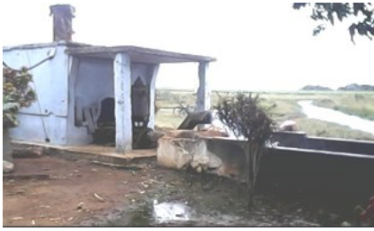
Turbina de la UBPC Las Mercedes