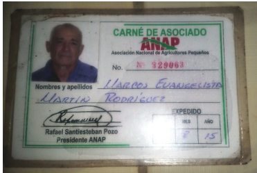
Carné de la Asociación Nacional de Agricultores Pequeños.