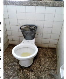
Taza sanitaria del Pediátrico

A: Salud Pública Provincial. De: Madres de infantes ingresados en la sala 5to Q del Hospital Pediátrico Oscar Concepción de la Pedraja, en la provincia de Holguín. Mediante la presente queremos presentar una queja acerca de las condiciones higiénico sanitarias y estructurales de los baños del hospital pediátrico de Holguín. Nuestros niños se encuentran ingresados en la sala 5to Q, por padecer diferentes patologías respiratorias como son: asma bronquial descompensada, neumonías bacterianas o de otras causas, entre otras afecciones virales. Después de estar expuestos allí a sufrir otras afecciones, además tenemos que soportar las malas condiciones de la sala y de los baños las cuales son críticas, una sala tiene alrededor de ocho a diez camas que son de ocho a diez niños, más las madres que cuidan a esos niños y para todas esas personas comparten un baño el cual cuenta con dos tazas sanitarias y una ducha. Los baños están en pésimas condiciones, de las dos tazas sanitarias que tienen solo funciona