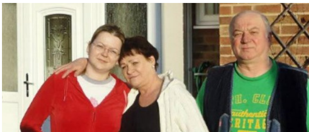
Serguéi Skripal a la derecha y su hija Yulia a la izquierda