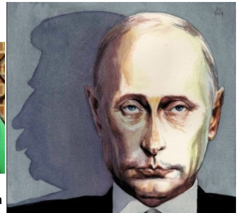
Vladimir Putin proyecta la sombra de Stalin