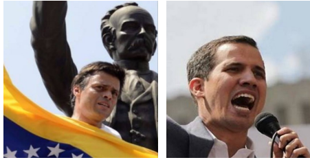
Leopoldo López junto a una estatua de José Martí en Caracas y Juan Guaidó.

“La libertad es el derecho que tienen las personas de actuar libremente, pensar y hablar sin hipocresía”. José Martí