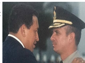
Hugo Carvajal, jefe de la Dirección General de Contrainteligencia Militar (DGCIM) durante más de 10 años en la etapa donde Hugo Chávez estuvo en el poder.

Juan Guaidó y Leopoldo López no tuvieron éxito en el levantamiento pero han demostrado una vez más que son audaces, dan la cara y se arriesgan junto al pueblo. Ambos pudieron haber sido