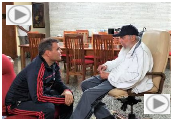
Vladimir Padrino López y Fidel Castro

A primera vista los elementos políticos en ambos países son iguales: dos dictadores que se eternizan en el poder gracias a las manipulaciones electorales, reconocidas por instituciones internacionales. Incluso, en el caso de Venezuela, la empresa encargada del conteo de las máquinas de votación reconoció la manipulación, lo que les costó el contrato con el dictador. En el caso de Bolivia fue la OEA quien demostró la superchería, lo cual hizo que el ejército dijera "basta" a más de 13 años de Evo Morales que buscaba una nueva elección.