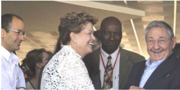
Raúl Castro durante la inauguración de la obra, en el centro la entonces presidenta Dilma Rousseff y a la izquierda el estafador Marcelo Odebrecht

En Cuba la constructora brasileña estuvo a cargo de los trabajos relacionados con el Puerto de Mariel, lo que Raúl Castro consideró: “la