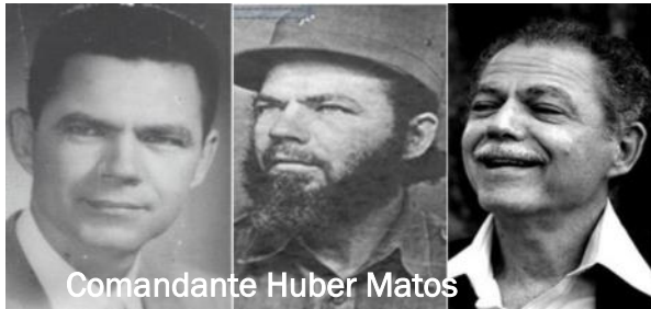
Comandante Huber Matos