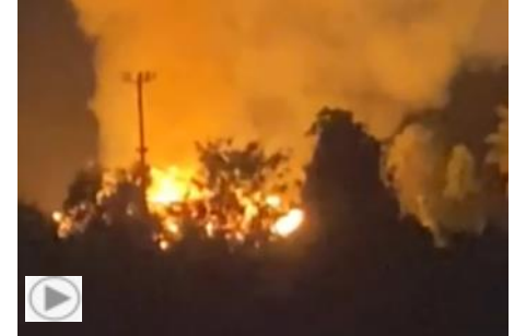
Pinar del Río, Agosto 13

Otra casa de tabaco ardió en San Juan y Martínez, en el mismo barrio El Paradero, donde el 4 de agosto había ardió una casa de tabaco .