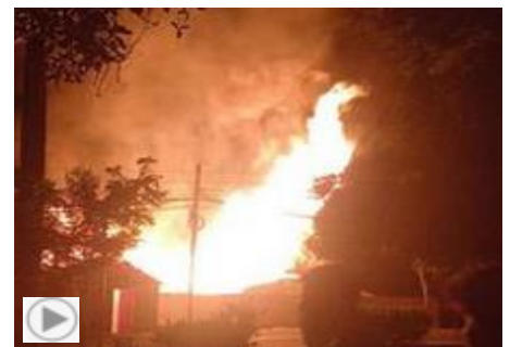
Pinar del Río, agosto 16

lar Rafael Freyre en su comunicado expresa: “Los actos de violencia no son la solución de los problemas, actos como estos dejan mucho que desear de las personas que los ejecutan y el pueblo freyrense, es un pueblo de paz, de amor es solidario, respetuoso, educado, fraterno, laborioso. El pueblo de Rafael Freyre repudia enérgicamente este hecho. Nosotros somos de Patria o Muerte. Venceremos”.