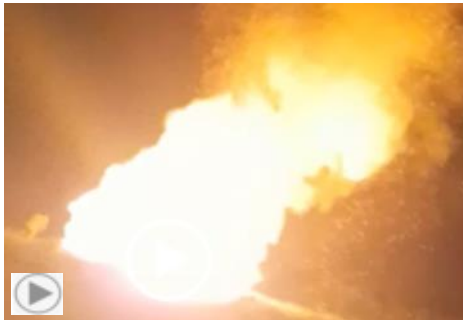
Pinar del Río, agosto 4

En el barrio El Paradero en San Juan y Martínez, Pinar del Río, quitaron la electricidad por más de ocho horas. Los vecinos no pudieron comer, más el calor, los mosquitos y arrancó la protesta a gritos de “¡Pongan la corriente! ¡Patria y Vida!