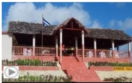
Holguín, agosto 5

En horas de la madrugada del 16 de agosto ocurrió un incendio en el local que ocupa el restaurante-cabaret El Caney de Minas de Matahambre que afectó esta instalación gastronómica. En estos momentos fuerzas del Ministerio del Interior cuantifican los daños e investigan las causas del siniestro”, indicó al mediodía de este martes en Facebook el medio local Radio Minas. Infocid