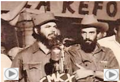
Con su amigo y compañero Camilo Cienfuegos desaparecido 7 días después