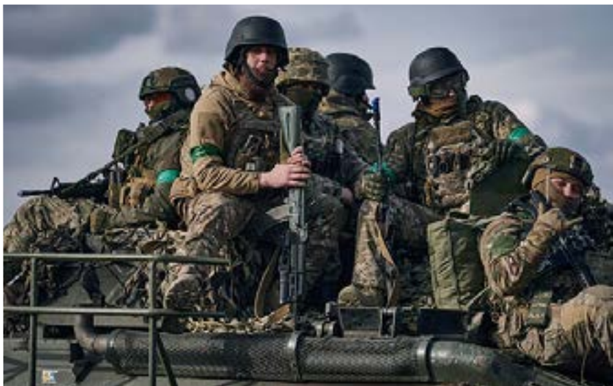
Soldados ucranianos en un tanque cerca de Bajmut