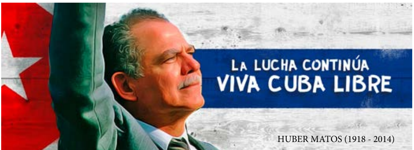
HUBER MATOS (1918 - 2014)

(2) https://www.cfr.org/article/how-much-aid-has-us-sent-ukraine-here-are-six-charts