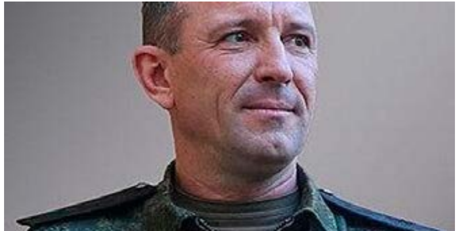
El general mayor Iván Popov, comandante del 58 ejército de las Fuerzas Armadas de Rusia