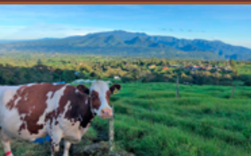
Pastizal de vacas en San Carlos, Costa Rica/PL