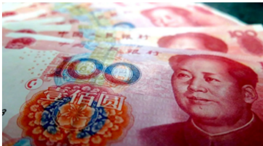
El renminbi, divisa de curso legal de la República Popular China también conocida como Yuan

“En Venezuela, ni qué decir”, expresó Guevara-Rosas, pues “todos los índices tanto de mortalidad materna como de violencia de género, de violencia contra las mujeres, particularmente de violencia sexual contra las niñas, a las mujeres trans, a las mujeres trabajadoras sexuales, ha ido en aumento”.