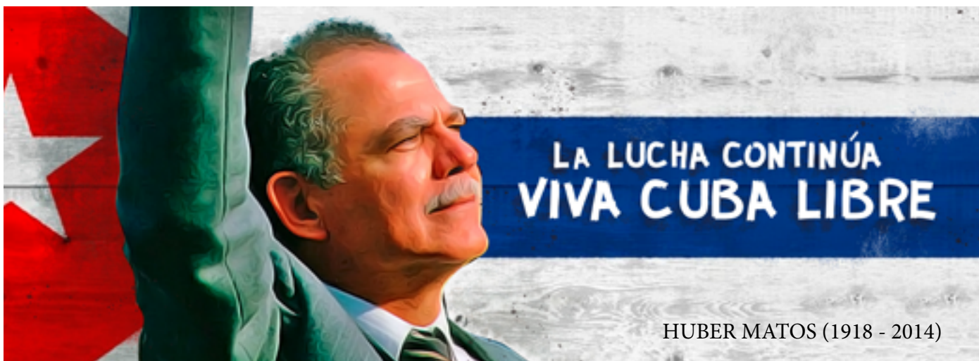
HUBER MATOS (1918 - 2014)

Grupo Jurídico de Ayuda Ciudadana La Habana, Agosto de 2023