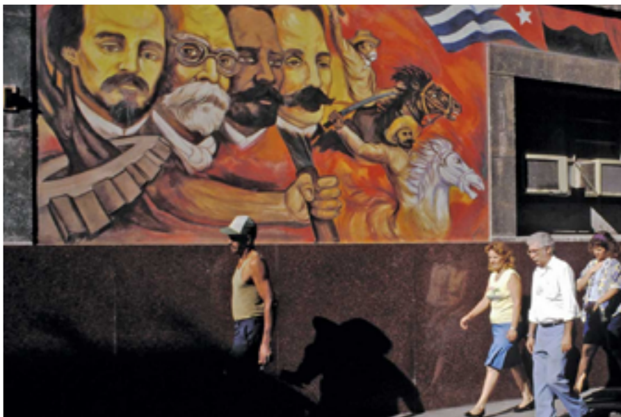
Mural en una calle céntrica de La Habana con los héroes de la patria del S. XIX

Las especificaciones que reporta Prensa Latina de cómo debe ser empacada la carne que va a Cuba no dejan duda de que su destinatario final es el turismo que visita la Isla y que de estas 24 toneladas al pueblo no llegará nada.