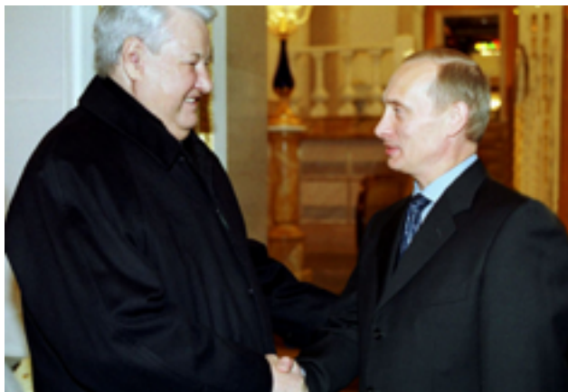
Boris Yeltsin y Vladimir Putin en diciembre de 2000

"La Ucrania moderna fue creada completamente y en su totalidad por Rusia, más específicamente por la Rusia