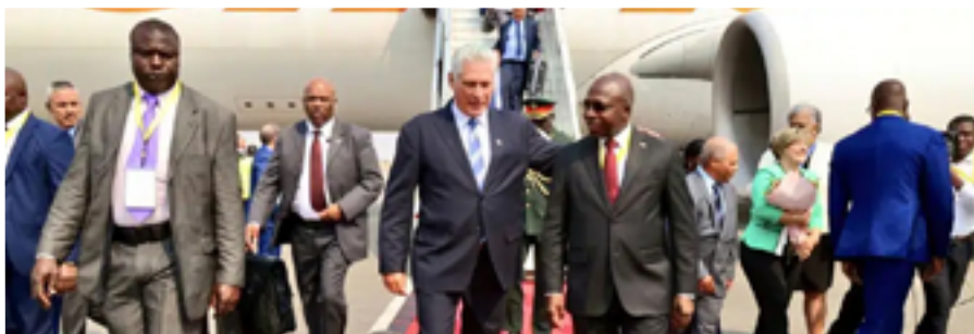
Miguel Díaz-Canel a su llegada a Luanda