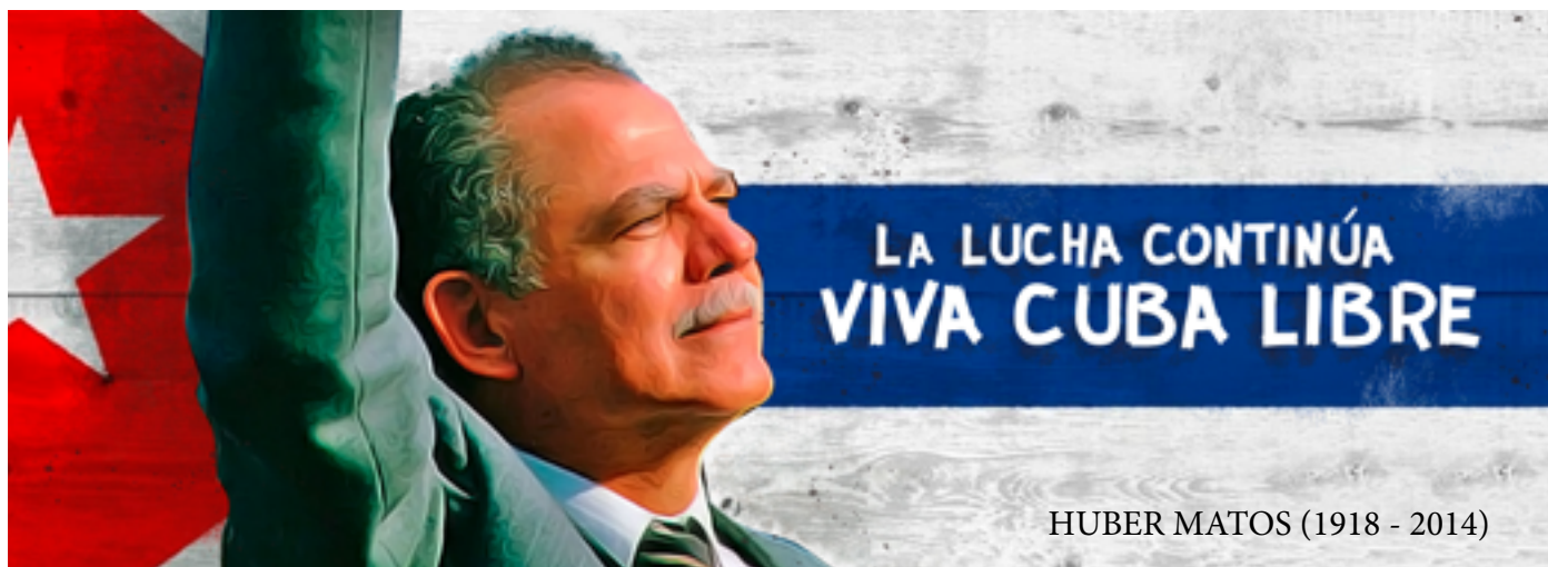
HUBER MATOS (1918 - 2014)