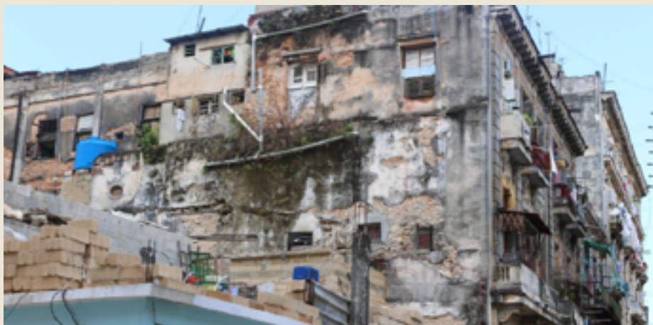
Fachada en ruinas de un edificio en La Habana