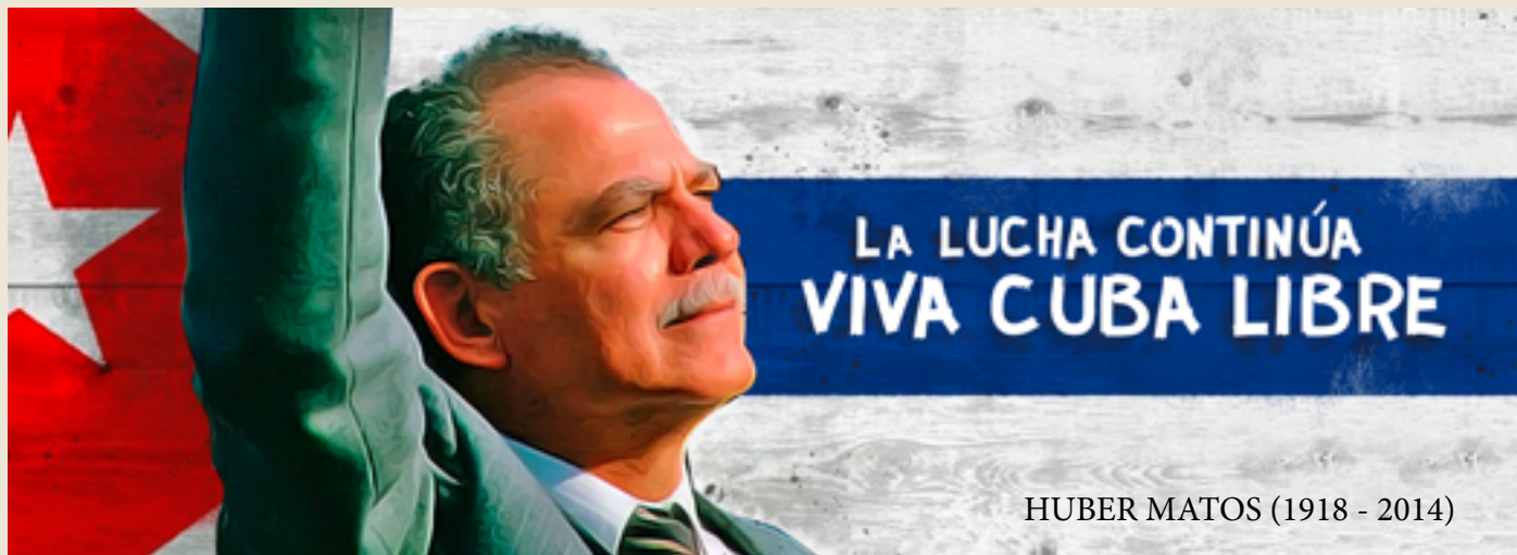
HUBER MATOS (1918 - 2014)