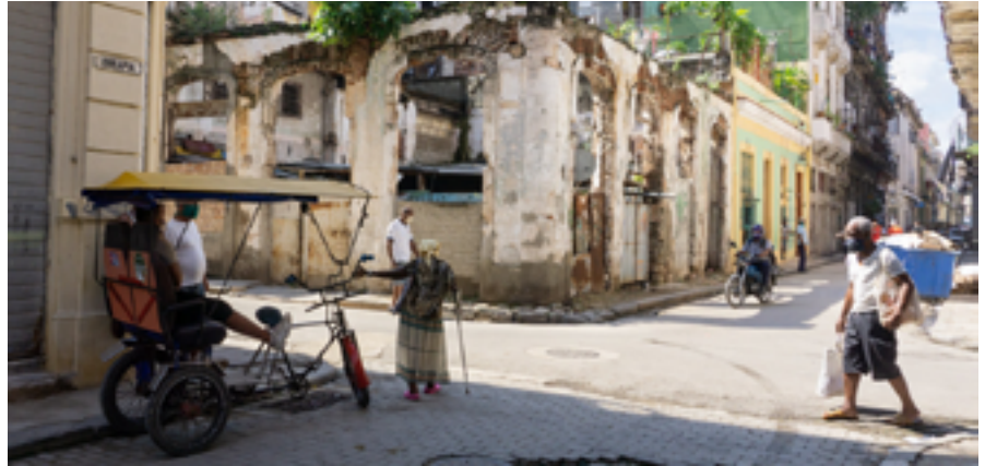
Cruce de calles en el centro de La Habana / CUBA