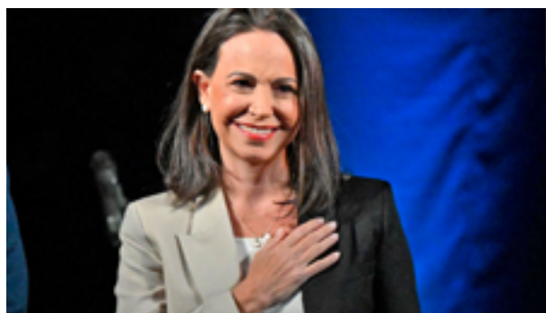
María Corina Machado, precandidata de la oposición de Venezuela

La Señora Machado continuó su lucha en silencio, buscando alianzas internacionales no a su favor sino a favor de la recuperación de la libertad en Venezuela. Visitó todos los rincones del país. Se ha hecho cargo de los inmensos dolores de la población de Venezuela que van desde el que produce el alejamiento de miembros de la familia inmediata que se han marchado para poder sobrevivir hasta el de encontrar en sus lechos a hijos a quienes la muerte se ha llevado en