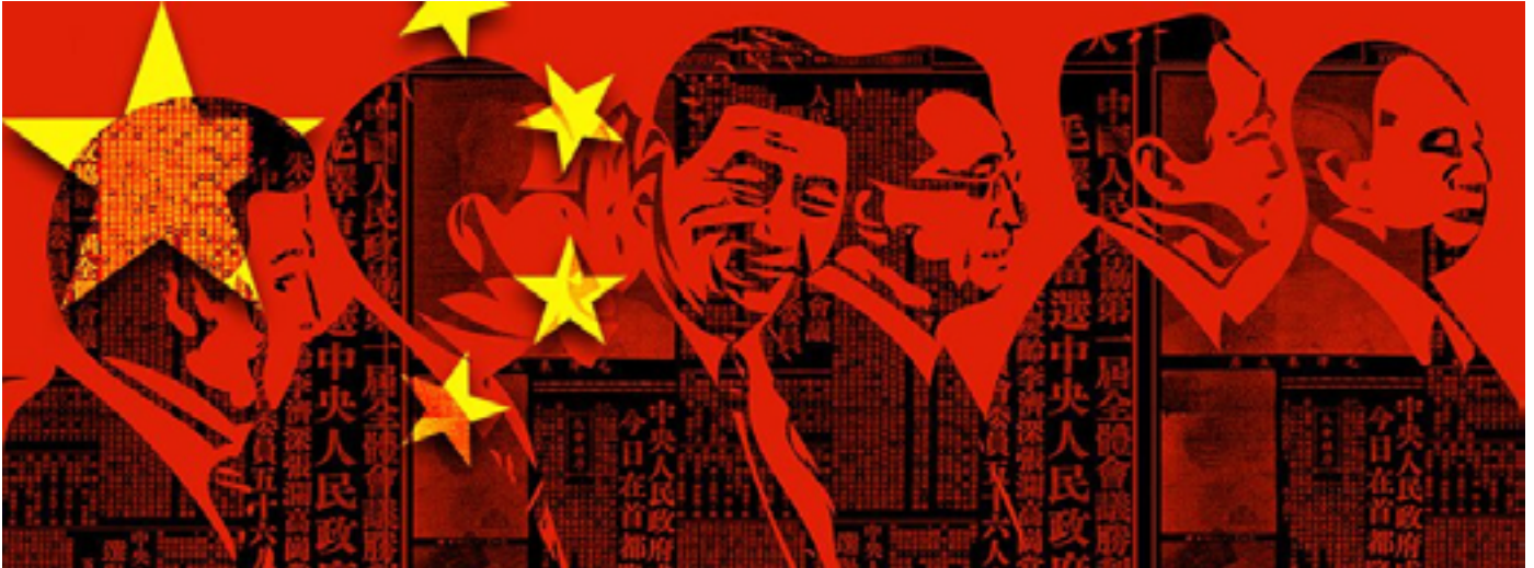
Ilustración. Kyle Matthews