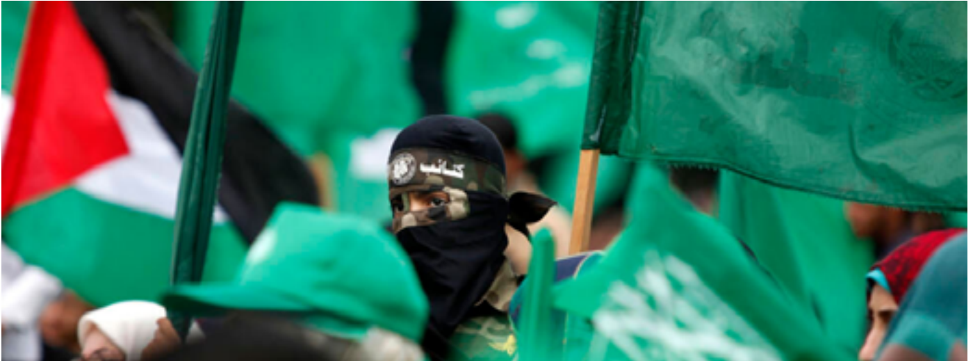
Concentración de seguidores de Hamás conmemorando el fallecimiento de su líder espiritual, Ahmed Yasin.