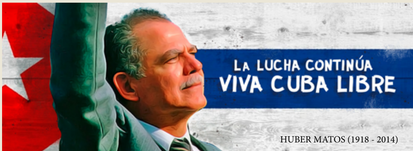
HUBER MATOS (1918 - 2014)