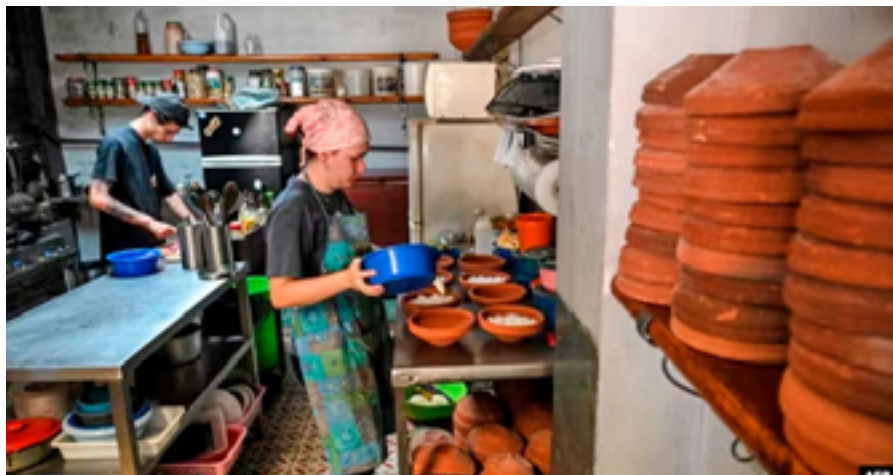
Una mujer y un hombre preparan raciones de comida en su negocio particular en La Habana, Cuba