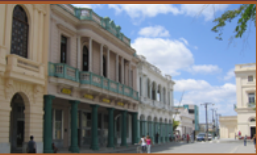
Calle principal de Santa Clara