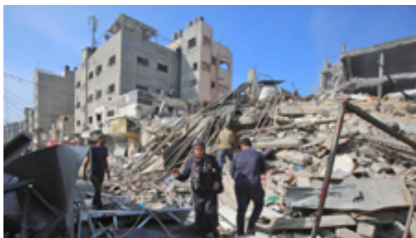
Un mes de guerra entre Israel y Gaza

Hezbollah, que tiene en Líbano muchísimo más poder militar que Hamás en Gaza, no se ha lanzado contra Israel hasta ahora. Saben que un ataque a Israel provocaría una respuesta devastadora. Israel le ha advertido a Hezbollah que si ataca, llevarán al Líbano a la edad de piedra. La pérdida de miles de vidas y la destrucción material tendrían consecuencias muy serias para Hezbollah, algo que no le importó a Hamas. El argumento de lo que han padecido los palestinos por causa de Israel durante décadas para “poner en contexto” la atrocidad cometida por Hamás el 7 de octubre es absurdo. Hamás no puso en peligro a la población en Gaza por ese sufrimiento. Lo hizo para provocar una incursión de Israel en Gaza que sería destructiva para la población civil de ese enclave por la sencilla razón de que los hombres armados de Hamás se esconden y atacan a Israel desde las áreas pobladas por civiles.