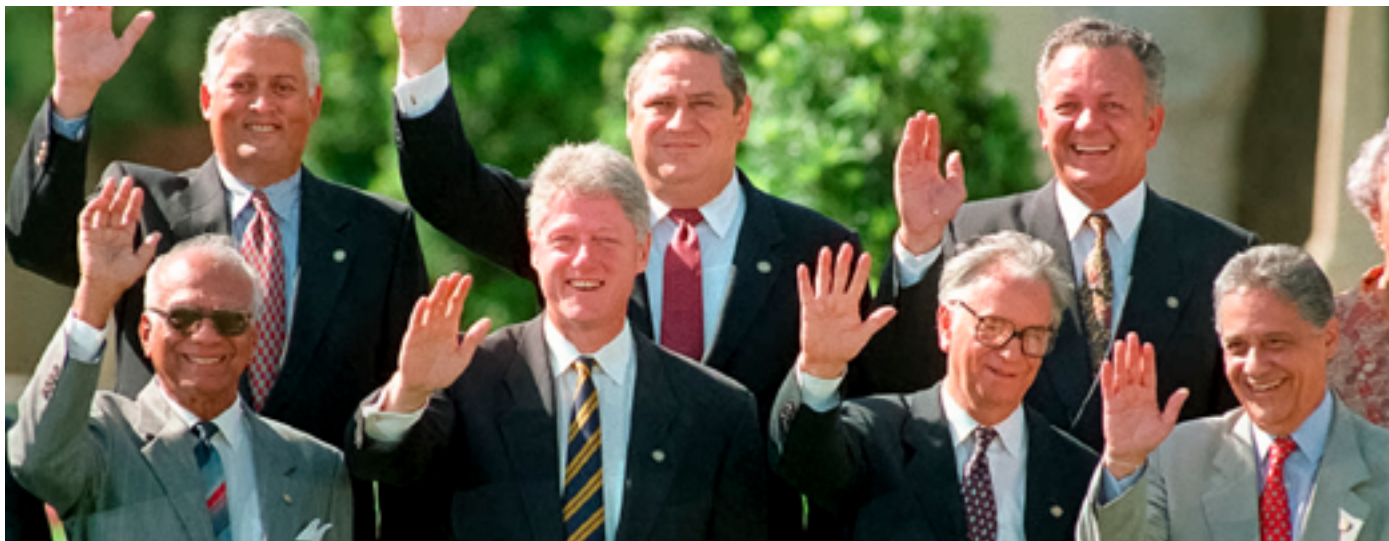
Líderes del hemisferio occidental saludan a la cámara en Miami durante la primera Cumbre de las Américas en 1994.