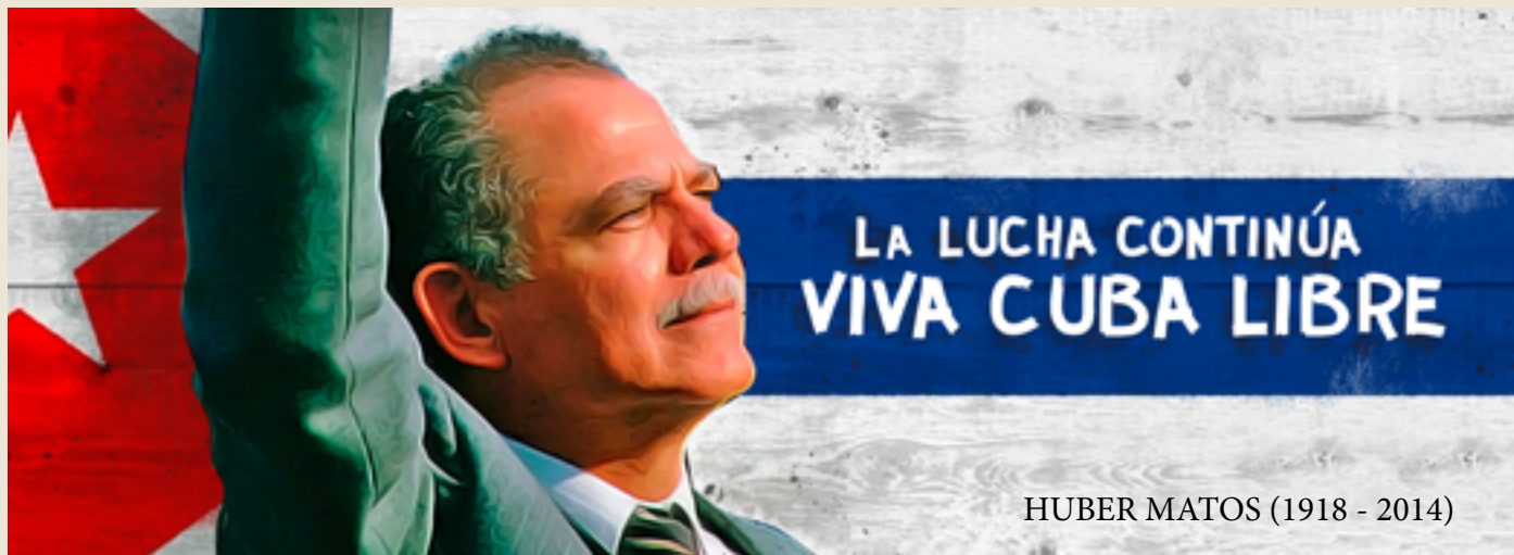
HUBER MATOS (1918 - 2014)