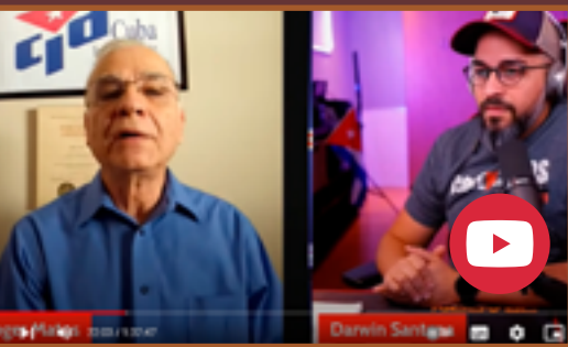
Momento de la entrevista de Matos y Santana para YT