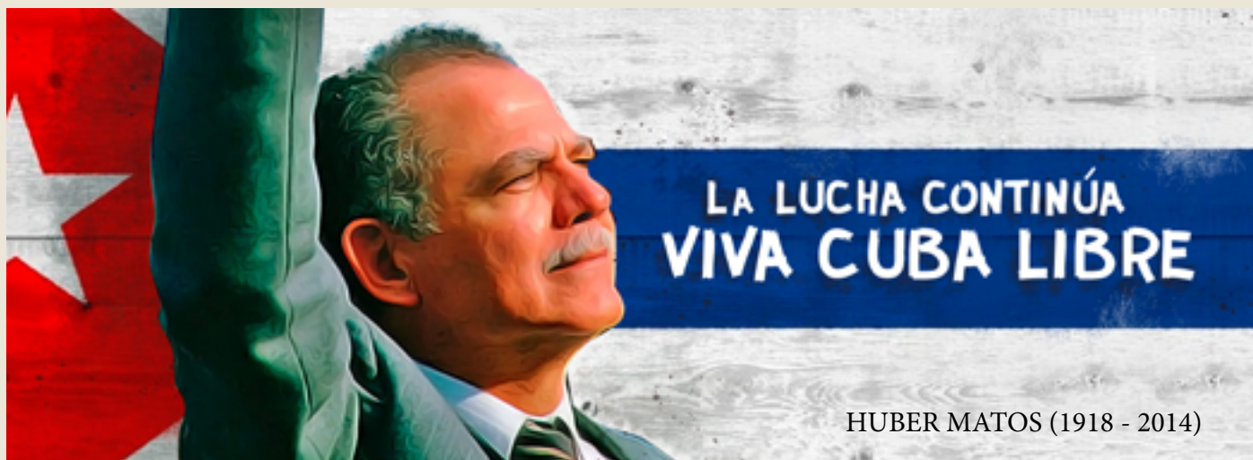
HUBER MATOS (1918 - 2014)

Por su parte, el número de turistas que visitaron la isla apenas superó los 2 millones de personas, frente a los 3,5 calculados por el Gobierno cubano a principios de año. Para 2024 se prevén 3 millones, una cifra aún lejos de los entre 4 y 5 millones que viajaban anualmente a la isla antes del periodo de la pandemia.