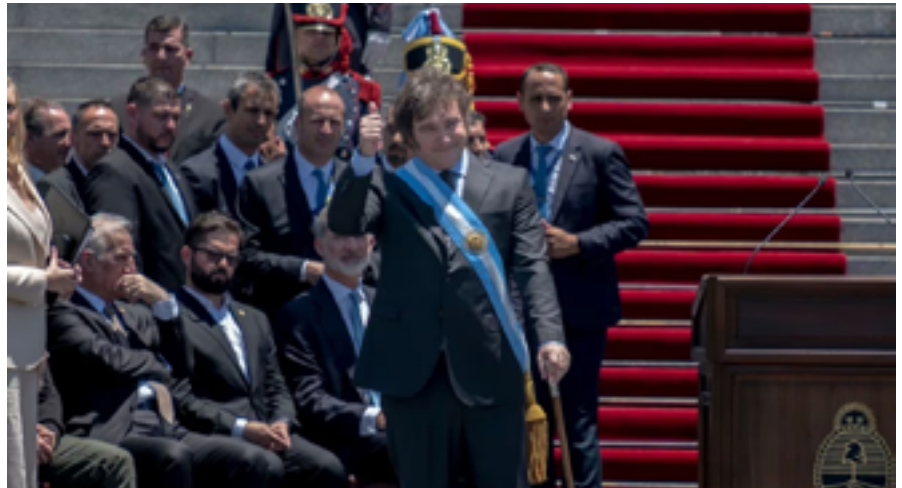
Javier Milei durante su toma de posesión, en Buenos Aires, el pasado 10 de diciembre.

Ese es el destino de un trabajador cubano: Vivir como dictan las leyes. No hay opción. Ni libertad”.