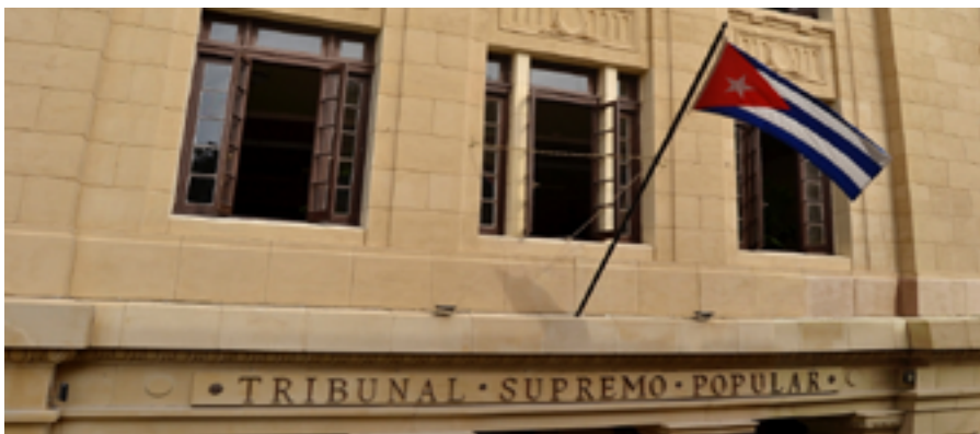
Tribunal Supremo Popular de Cuba en La Habana

Este año que termina ha dejado un mal augurio para las tiranías. No es que 2024 sea el año de todas las soluciones; siempre habrá víctimas, sólo que esta vez será de ambas partes. La tormenta está sobre las cabezas de todos. La buena noticia es que el miedo, el miedo mayor, está del lado de los que más tienen que perder, del lado del enemigo.