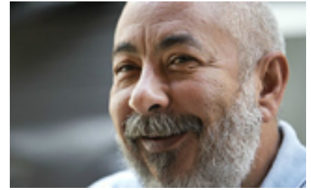
Padura es el creador del célebre detective Mario Conde.

No se puede “revivir un muerto” y esa es la intención del gobierno cubano”, concluyó el economista.