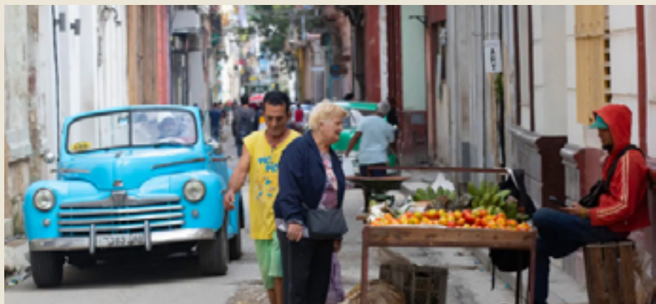
Una mujer observa los productos de un puesto ambulante, diciembre de 2023, en La Habana (Cuba).

El Gobierno cubano estima ahora que el producto interno bruto (PIB) se contraerá este 2023 entre un 1 % y un 2 %, tras haber pronosticado un crecimiento del 3 % a