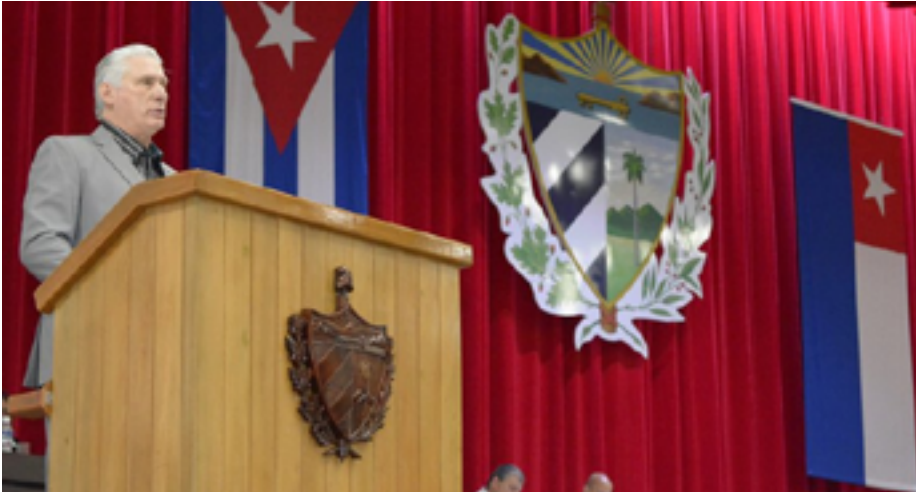
Discurso de Díaz Canel en la Asamblea Nacional del Poder Popular en su IX Legislatura

MARTÍ NOTICIAS. Exilda Arjona Palmer. 19/12/2023