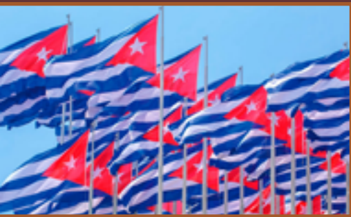
Ilustración / GEMINI