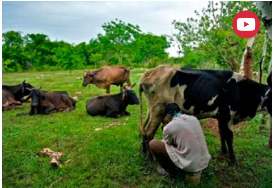
Un campesino cubano ordeña a una de sus reses

Por Bárbara Gonzales. DEFENSORÍA DE BAYAMO