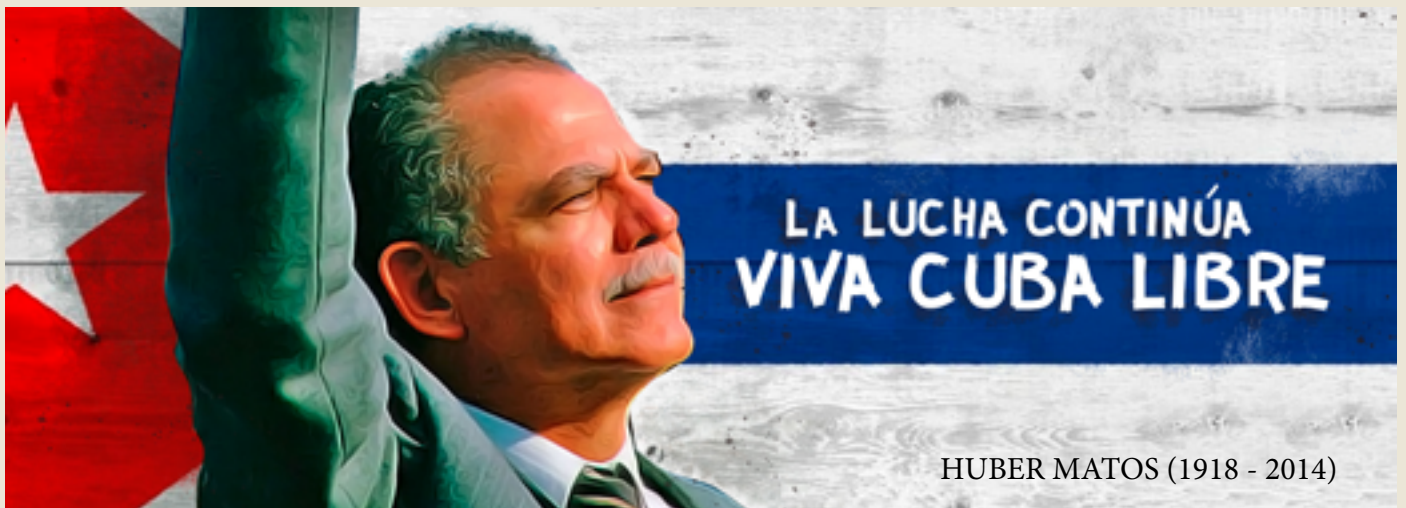
HUBER MATOS (1918 - 2014)

Fuente Caplinnews, Universidad de Florida