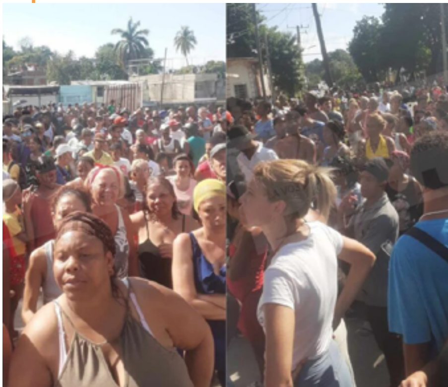
Centenares de cubanos se manifestaron en Santiago de Cuba, para protestar por la escasez de alimentos y los prolongados apagones diarios en la isla, sumida en una profunda crisis desde hace tres años / CB

Fuentes: lapatilla.com , Infocid Video https://youtu.be/cob2ST30fBk