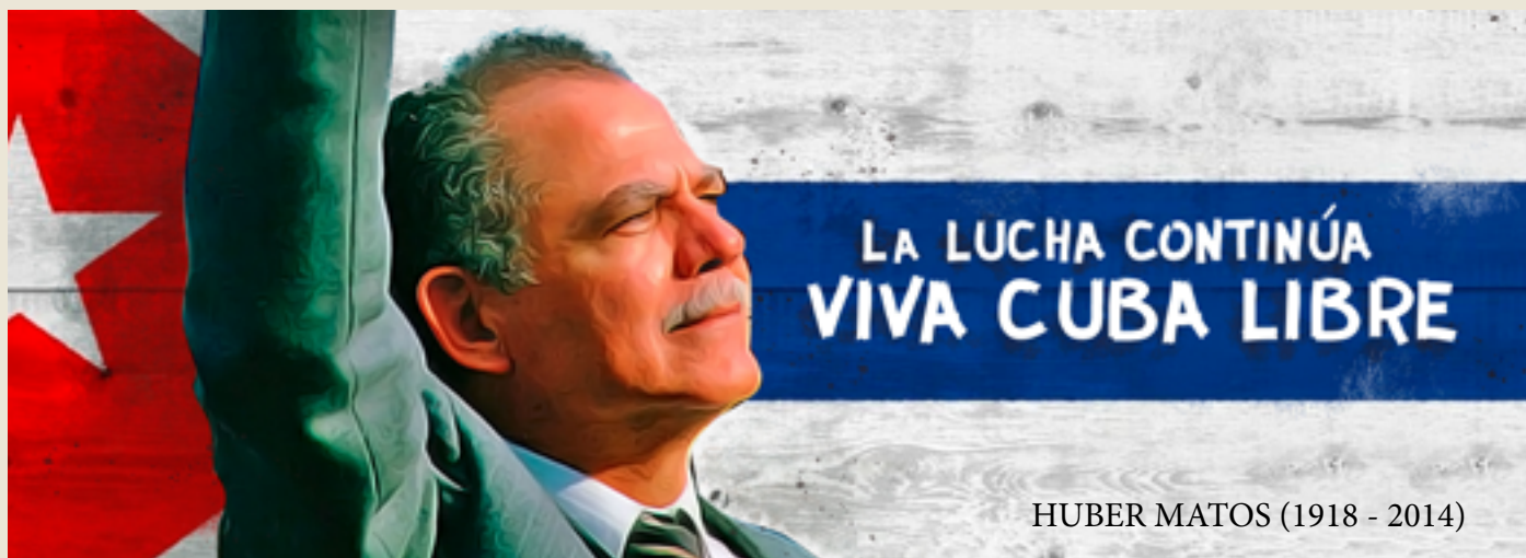
HUBER MATOS (1918 - 2014)

PATRIA, PUEBLO Y LIBERTAD Ejecutivo Central del CID 2002