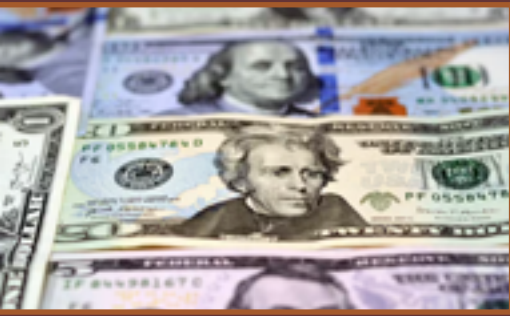
El logo de PKN Orlen, la principal refinería de petróleo de Polonia, en una gasolinera en Varsovia, Polonia