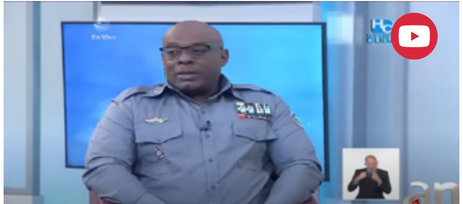
El coronel Hugo Morales, segundo jefe de la Dirección General de la Policía en el Programa de TV, HC / YT

El cubano promedio vive en una burbuja de incertidumbre y desesperación que no le permite darse cuenta, y apreciar, las transformaciones globales que están cambiando el mundo, como lo conocíamos. Parece que no está pasando nada, cuando en realidad estamos a punto de experimentar un cambio explosivo de paradigma que no dejará indiferente ni a los más escépticos.