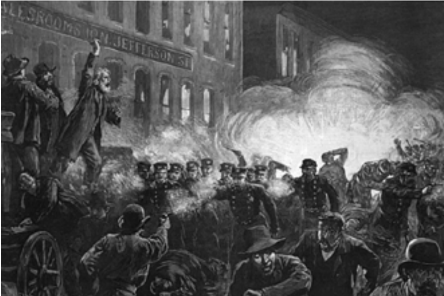
Masacre de Haymarket, 4 de mayo de 1886 en Chicago (Estados Unidos)