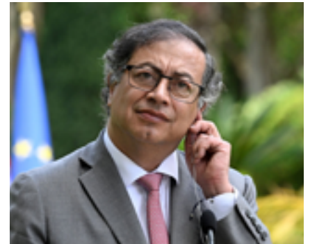
Gustavo Petro, Presidente de Colombia, / .E. M.