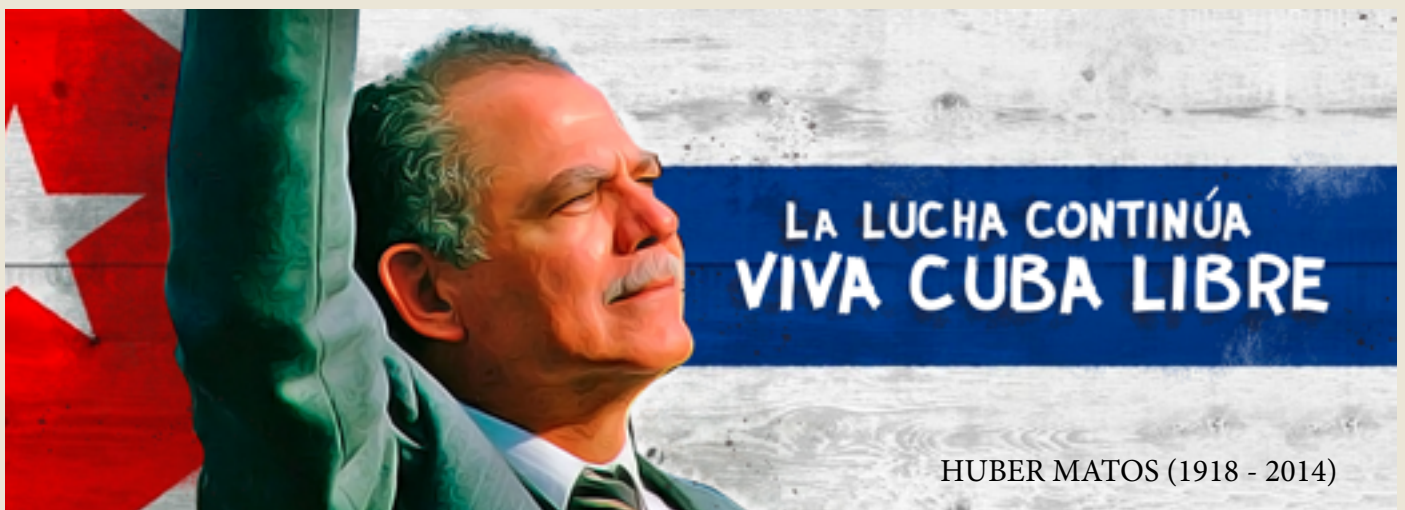
HUBER MATOS (1918 - 2014)