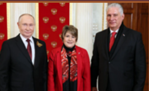
Miguel Díaz-Canel visita a Putin durante su reciente viaje a Rusia