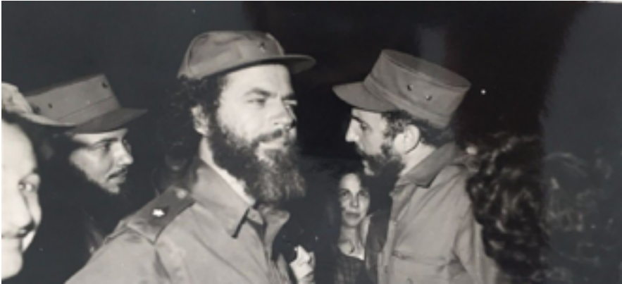
Huber Matos, comandante de la Revolución y Fundador del CID

El CID invita a nuestros compatriotas en el exterior a participar en un esfuerzo que no exige unidad ideológica ni política sino el común anhelo de respaldar a nuestros Soldados de la Libertad.