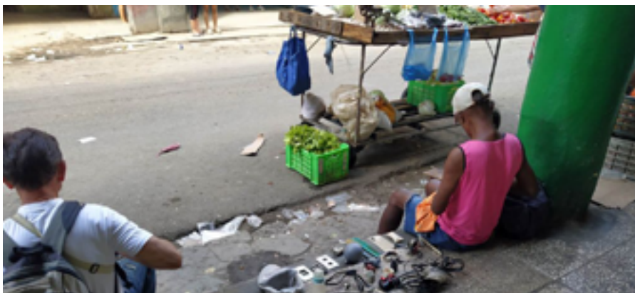
Vendedores ambulantes de chatarra en el centro de La Habana

La imposición de largas condenas con las cuales el régimen ha intentado usar a manera de escarmiento es una estrategia que claramente ha demostrado no funcionar pues cada vez son más los jóvenes que se rebelan contra el sistema a pesar de las consecuencias.