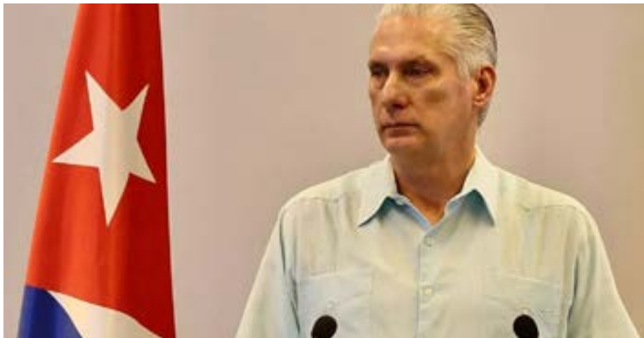
Miguel Díaz-Canel afirmó recientemente que Cuba está en conversaciones con Washington en busca de alivio económico.

Consejo Editorial del Wall Street Journal - 19 de marzo de 2026