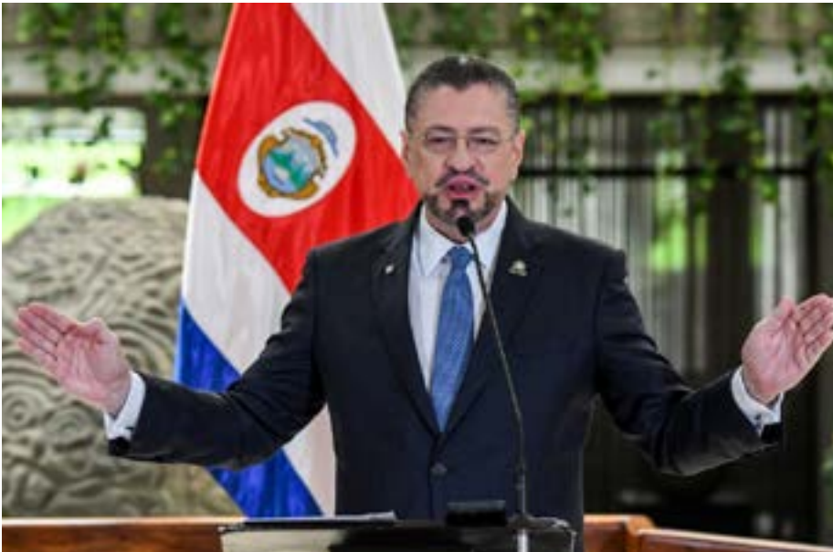
Rodrigo Chaves Robles es el 49° presidente de la República de Costa Rica desde el 8 de mayo de 2022.