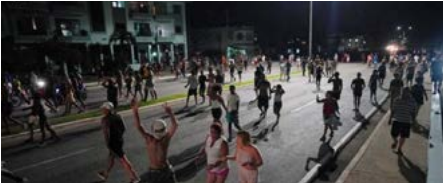
Miles de cubanos protagonizaron más de 50 manifestaciones en los últimos días en las que piden "luz" y "libertad"...